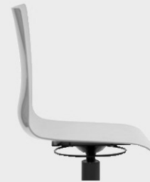
Ringauslöser einfach bedienbare Sitzhöhen- verstellung aus unterschiedli- chen Sitzpositionen